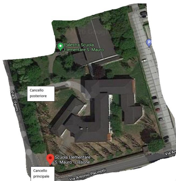
SCUOLA SAN MAURO