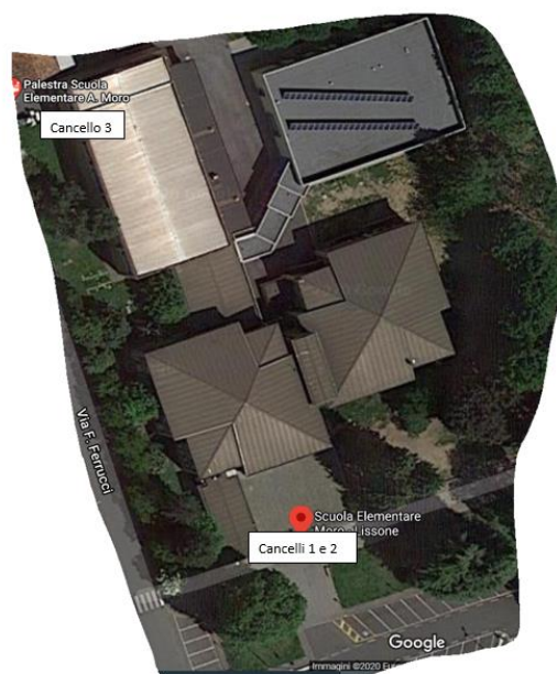
SCUOLA ALDO MORO